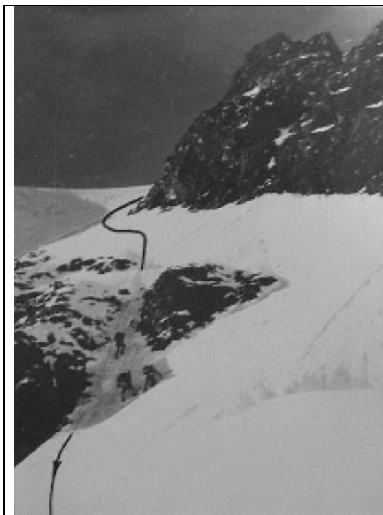
Laskumine Adiši ülemiselt platoolt alla alumisele platoole