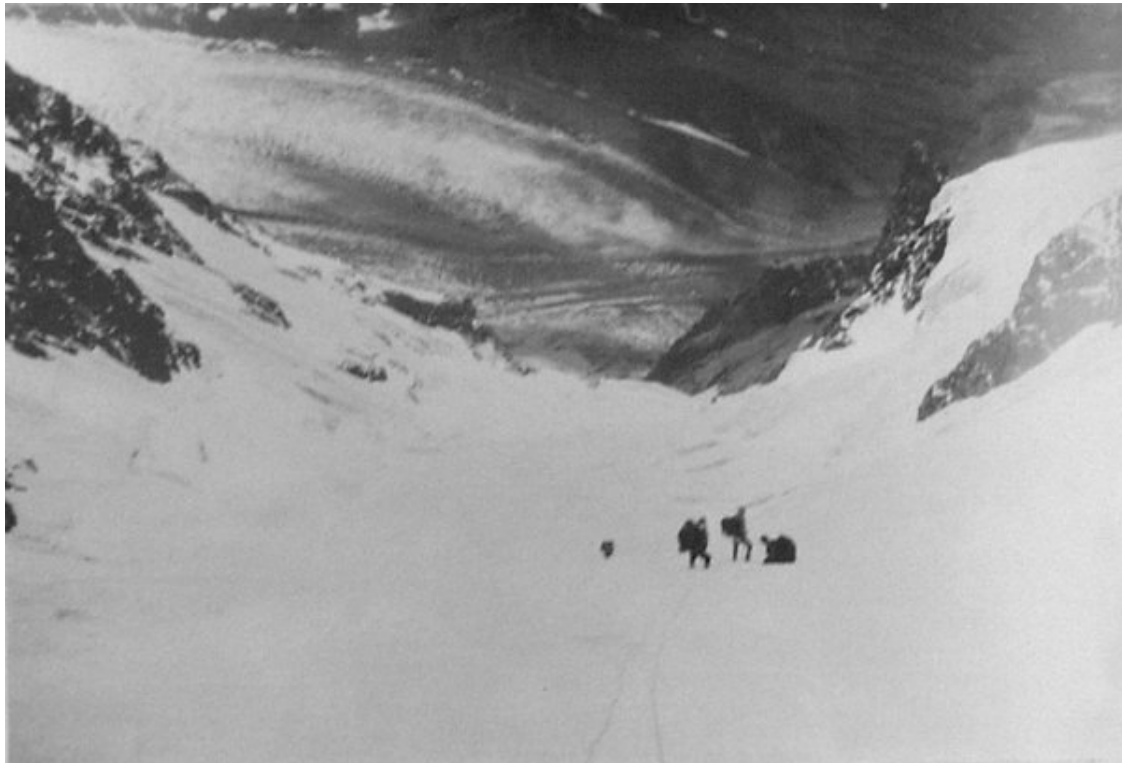
Ost.doma kurult laskumise algus, all näha Halde liustikku.