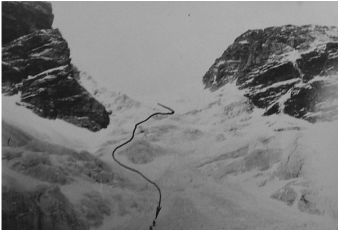
Ost.doma laskumistee ülemises jäämurrus – näha traavers jäärebendi kohal ks. paremale.