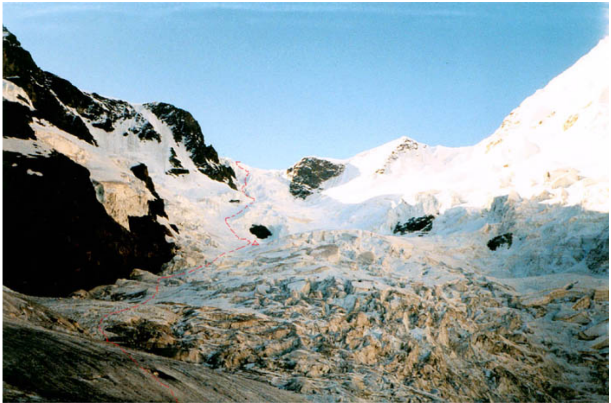
пер. Добровольского. Вид с ночевки на л. Оиш.