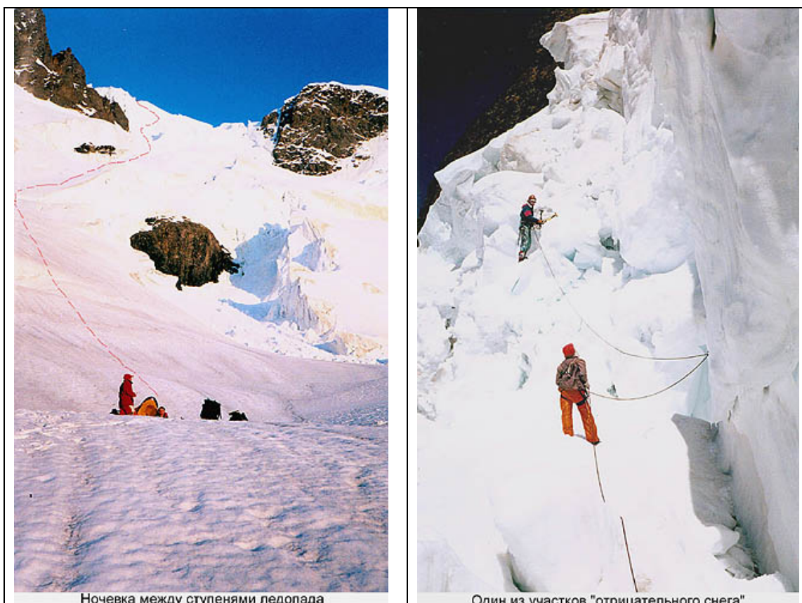
Ночевка между ступенями ледопада